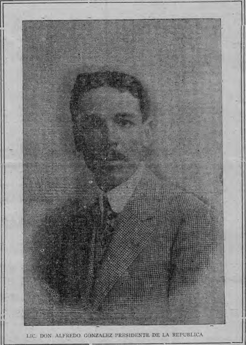
LIC. DON ALFREDO GONZALEZ PRESIDENTE DE LA REPUBLICA